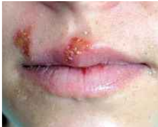
Abb. 1: Herpes labialis: mit solchen Lippen kann man kein Blasinstrument mehr spielen.

Herpes ist ein heimtückisches Virus, das HSV-1-Virus. 15-30% der Bevölkerung sind betroffen. Das Virus macht in den Nervenfasern des Nervus facialis (Gesichtsnerv), z.T. auch in den Lippen-Zellen, sozusagen seinen Dornröschen-Schlaf. (Abb. 2) (Es gibt auch die HSV-2-Viren, Herpes genitalis, aber das ist ein anderes Thema...) . Sobald der Fasnächtler den Körper und insbesondere die Lippen durch Küssen des Instrumentes und anderem überstrapaziert, stresst und/oder unter Schlafentzug oder an einer Überdosis Sonneneinstrahlung (an der Fasnacht wahrscheinlich nicht ein Hauptgrund) oder an vorausgehendem Fieber, körperlichem oder emotionalem Stress, hormonellen Veränderungen, Veränderung der Essensgewohnheiten (Ernährung durch