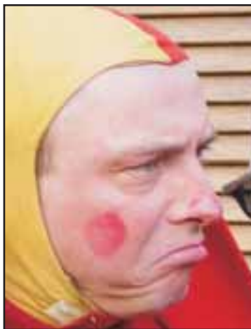
Den einen gefällt's, den anderen nicht...

Innerhalb einer Stunde war die Umzugsroute abgelaufen. Leider waren wir erneut eine der letzten Nummern (33), so dass wir nach dem Umzug im Eiltempo zur Firma SevenAir in die Baselstrasse zum Auf-