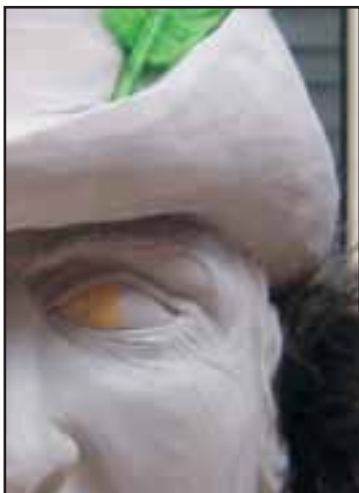
Ein Ausschnitt des Modells unseres neuen Grindes.

In der nächsten Ausgabe werden wir uns näher mit der Frage auseinandersetzen, wie aus einem Silikondings, das wir aus dem Fernsehen von den vielen berühmten Frauen kennen, die Vorlage für das andere Dings wird, dass wir dann an der Fasnacht auf dem Kopf tragen. Und das wird sicher eine ganz spannende Sache, da gehts nämlich um so hübsche Angelegenheiten wie mit Silikon rumplantschen und Plastikzeug schwingen und ums Schleifen und vieles mehr.