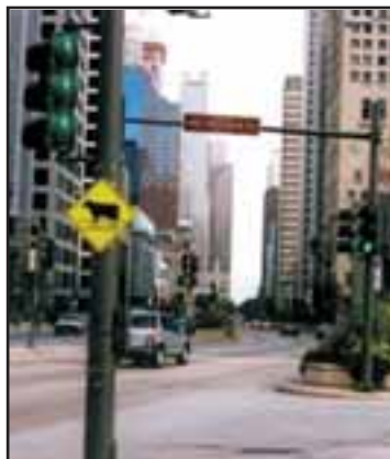
Die Noggeler mit dem Sujet "Farinelli" in Chicago. Was für ein Bild!

Für typische Luzerner Stimmung sorgte während des Besuchs in Chicago die Guuggenmusik Noggeler. Die Noggeler erhielten bei ihren Auftritten von allen Luzerner Präsentationen die grösste Aufmerksamkeit. Die mit 40 Mann und Fanclub auf Einladung des Generalkonsuls und der Swiss Week angereiste Formation spielte am Dienstag Abend so schön und laut auf, dass die Klänge noch im Swimming Pool vom 42. Stock des Hotels zu hören waren. Ein sicherer Wert waren die Noggeler zudem während eines Auftritts für Auslandschweizer im so genannten Brauhaus am Montag Abend. Aber auch auf dem Rathausplatz von Chicago spielten sich die Luzerner schnell in die amerikanischen Herzen. Kein Wunder, in einem Land, wo eine gute Show und die Grösse einer Band geschätzt werden.