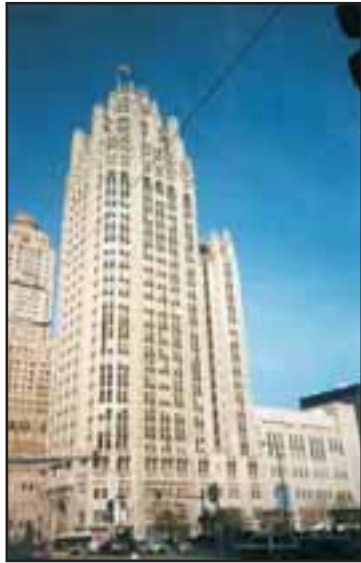
Der "Tribune Tower", das Zuhause der Chicago Tribune