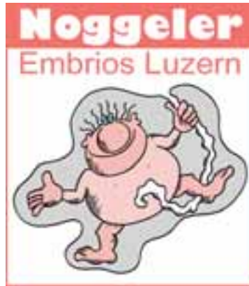
Der Embrio-Noggeler (natürlich noch ohne Noggi...)

Und zwar wurden ja im Frühling des diesjährigen Jahres der Verein der "Noggeler-Altherren" gegründet. Das ist so ein Verein, da sind alle dabei die nicht mehr konnten oder nicht mehr wollten oder gar nicht mehr gewollt wurden. Und als die dann eine Website gemacht haben dacht ich mir, ich mach denen Mal ein Geschenk und habe einen Noggi-Altherren kreiert. So ganz wie man sich das halt vorstellen tut mit Stock und so und diesen alten, erdfarbenen Mustern und mit Hut. Jawohl ein Hut. Weil alle alten Leute tragen entweder Hut oder Toupet. Das ist eine Regel oder so. Damit sie immer sitzen können im Bus und nie lange an den Kassen anstehen müssen.