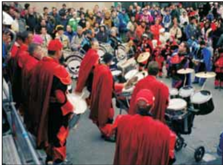
Die Noggeler "Zuekonftsmusig" auf der Guuggerbühne hinter dem Schweizerhof.