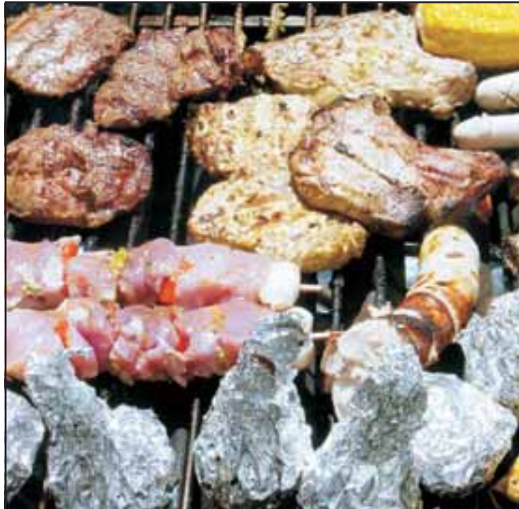
Breakfast for Champions

Ein Dank geht an: Hebi für die Musikanlage, Böni und Töge für die wertvolle Mitarbeit bei der Organisation, Lukas für den Wein, die Idee mit dem Picknick und die Zehnjahresreservation und allen Helfern, besonders den neuen Embrios beim Aufbau und Abbau.