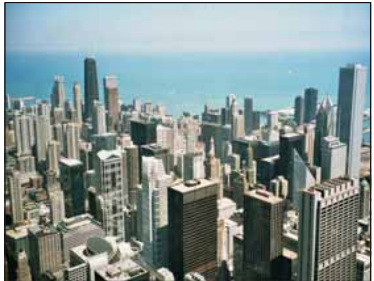
Die beeindruckende Skyline von Chicago. Schon bald werden die Noggeler durch die Michigan Avenue marschieren.

Am diesjährigen Lights Festival im November setzen wir nun diese Tradition fort. Dieses Fest "markiert" den offiziellen Beginn der Weihnachtszeit. Die Besucherzahlen an diesem Riesenfest liegen zwischen 0,5 und 1 Million (in Amerika ist halt alles etwas grösser). Es sind rund 650 Geschäfte, Restaurants und Hotels rund um die Michigan Avenue, die diesen Anlass organisieren. Die Hauptattraktion ist die Mickey Mouse Prozession, bei der Mickey als Hauptfigur vorausfährt und alle Lichtlein der Weihnachtsbeleuchtung an den Bäumen der Michigan Avenue anzündet. Wir sind Teil dieses Umzuges und fahren mit einem oben offenen Doppeldecker-Bus musizierend hinter Mickey her. Weitere Auftritte sind vor der City Hall (Rathaus) von Chicago, dem